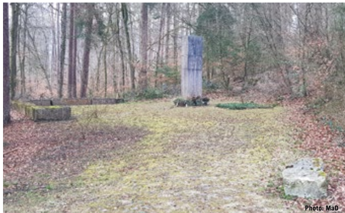
Mémorial du crash SR 330 à Würenlingen

Dans les secondes qui suivent, l'avion s'écrase dans un fracas assourdissant, dans une forêt près de Würenlingen, entraînant 47 personnes dans la mort, dont 9 membres de l'équipage.