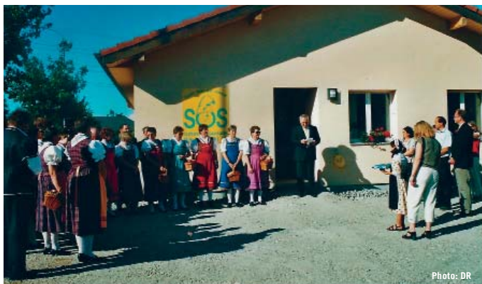
Inauguration du Centre SOS Futures Mamans de la Gruyère à Bulle