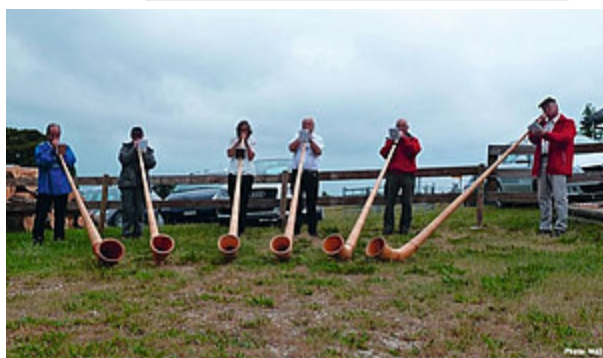
Louange sur l'alpage